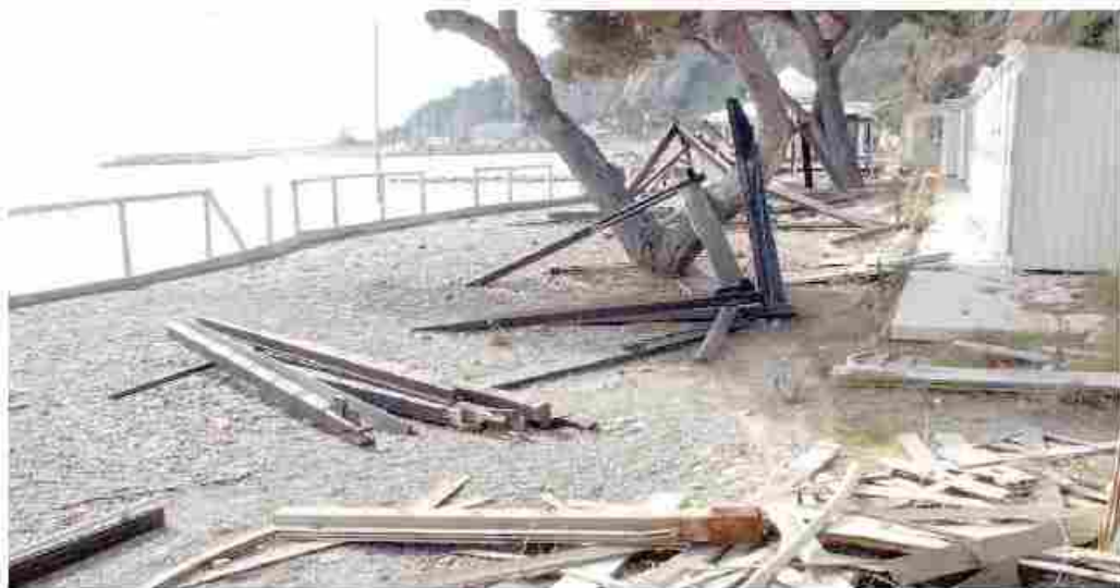
Una perla abbandonata La spiaggia degli Zero Beach ad Alassio totalmente in preda all'incuria e al degrado

Ma evidentemente né questa situazione, né lo stato della strada di accesso dall'Aurelia letteralmente invasa da rovi e ter-